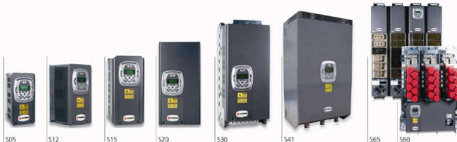
ابعاد و وزن مدل های 2T/4T Dimensions and weight models 2T/4T